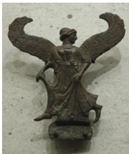
Ilustración 2. "Niké" (nombre de la diosa de la Victoria).

Tomó tanto empeño en llegar a su destino a la mayor brevedad que, cuando llegó, cayó agotado y antes de morir sólo pudo decir una palabra: "Niké" (nombre de la diosa de la Victoria).